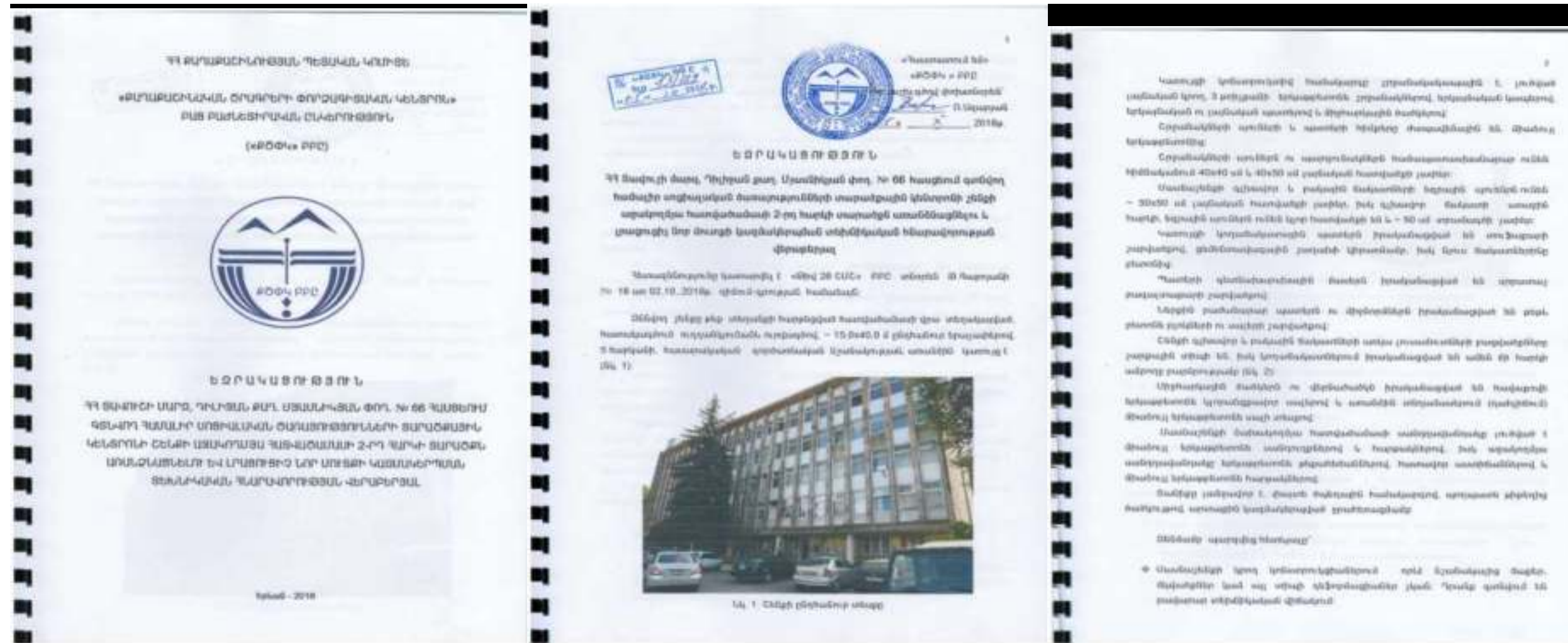
Հավելված 3. Շենքի տեխնիկական վիճակի և վնասվածության եզրակացություն