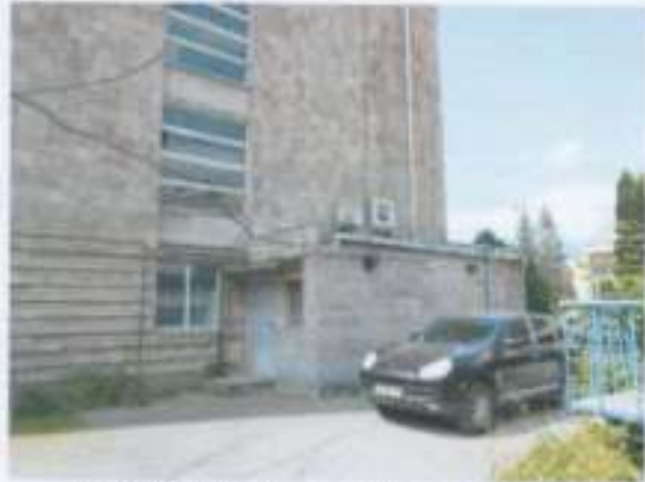
Նկ. 2. Ենթակառուցվածքային առանցքային շենքերի տեսքը

Ենթակառուցվածքային առանցքային մասնագրանցի և մասնակրանցի 2-րդ հարկի տեխնիկական ՓՃՆԱԿը պատկերված է բաղադրատեղի վառարանային ձևապատկերը ըստ ԴՄՆ Ի-Ց 02-2006 և հետազոտության մեթոդական ցուցումների լավագույնից դասվում է 2-րդ աստիճանը: