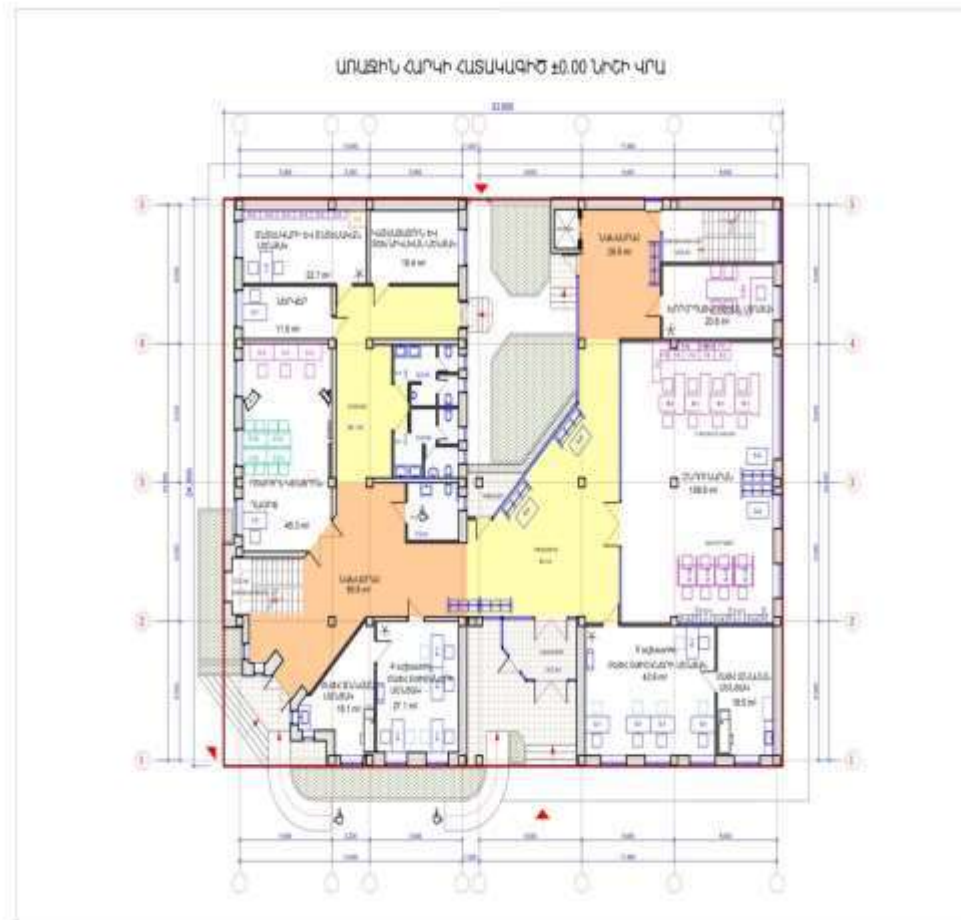
Հավելված 1. Շինարարական քարտեզը/լուսանկարները